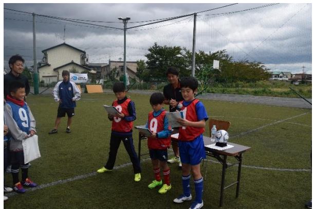
半年間の振り返りの発表