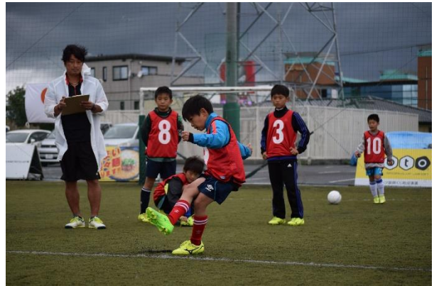
フリーキック検定試験