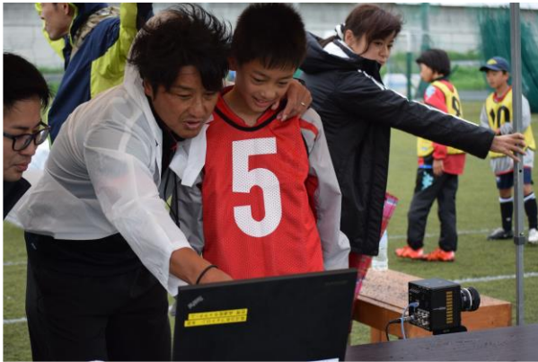
ハイスピードカメラによる映像分析